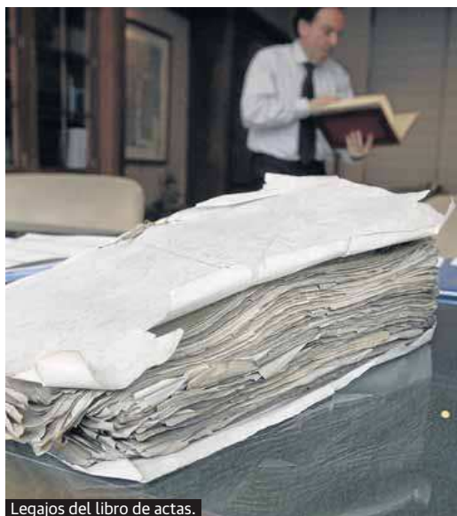
Legajos del libro de actas.