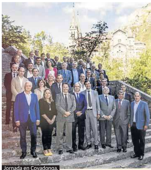
Jornada en Covadonga.

las mismas. Veamos. Un año después de la fundación, se impulsa la creación de la Escuela de Comercio que acabará siendo la de Empresariales. En 1902 solicita la instalación en Oviedo de una Escuela de Enseñanza Agrícola; propone la creación de asociaciones sindicales agrícolas y gestiona la creación de entidades de crédito agrícolas cajas rurales y propone al Ayuntamiento de Oviedo la celebración durante las fiestas de San Mateo de una exposición de maquinaria agrícola y aperos de labranza.