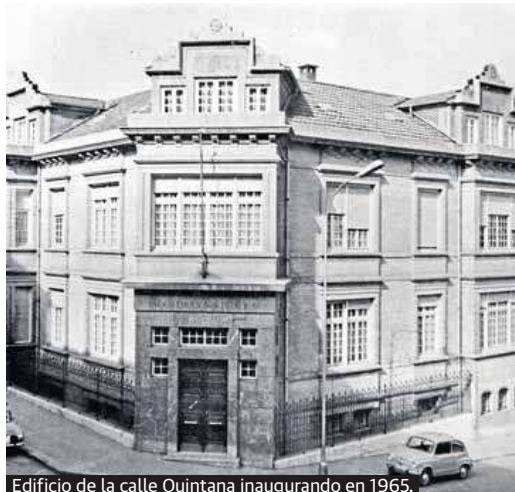
Edificio de la calle Quintana inaugurando en 1965.